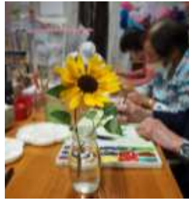
絵手紙教室や臨床美術教室が人気です