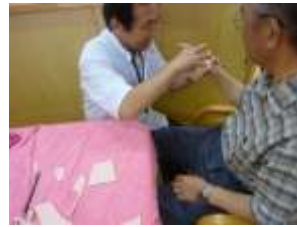
作業療法士が個別のリハビリを行ないます