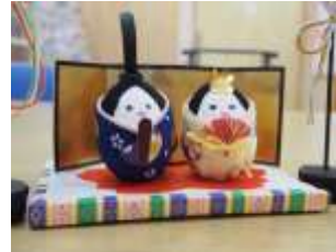
野菜やお花を育てています 手芸が充実☆