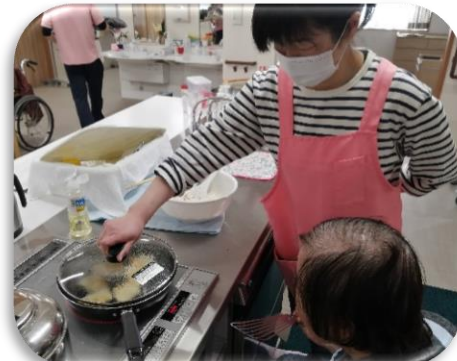
体や指先を動かしリハビリ!! カラオケやクッキングもあります