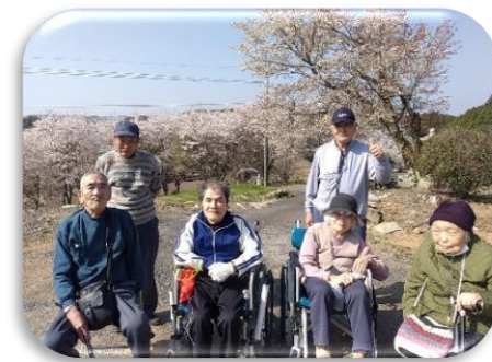
運動会やドライブ!! 季節に合ったイベントもあります