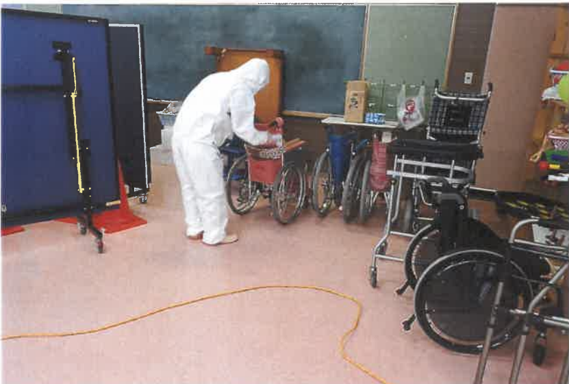
倉庫アルコール拭き上げ