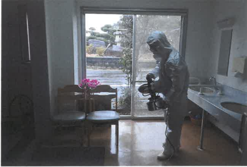
機能訓練室消毒薬噴霧