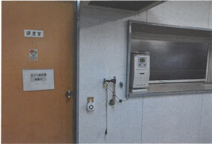
厨房内オゾン発生中