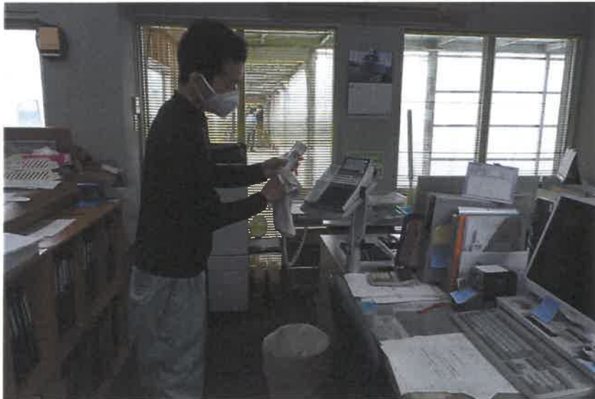
事務所内アルコール拭き上げ②