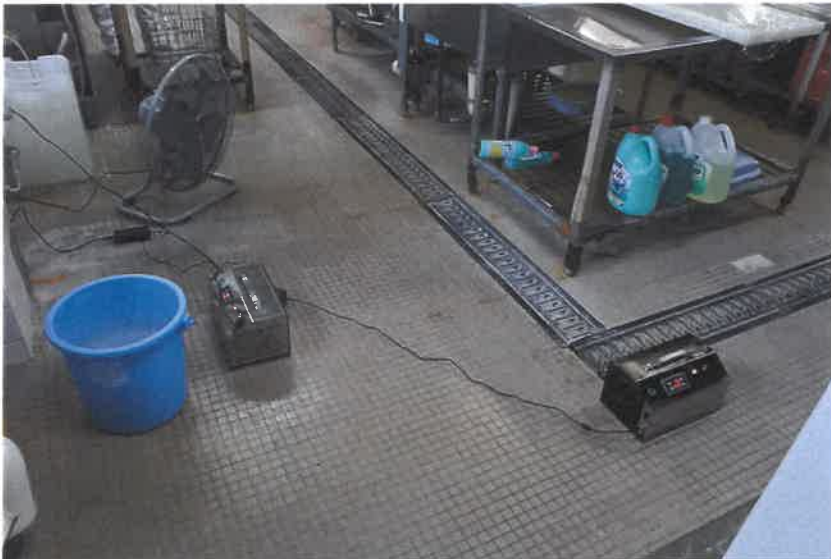
厨房オゾン発生器