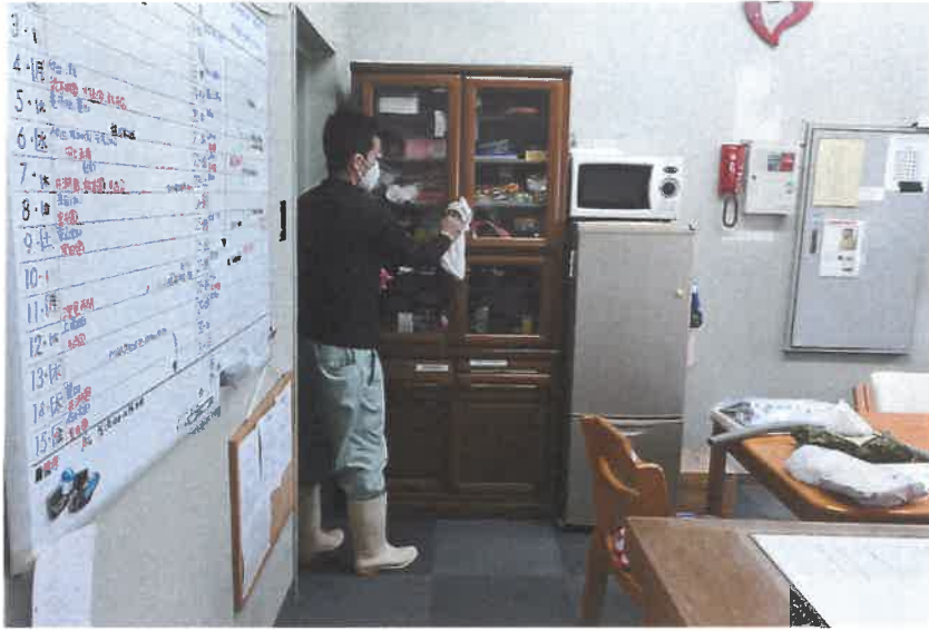
事務所内アルコール拭き上げ