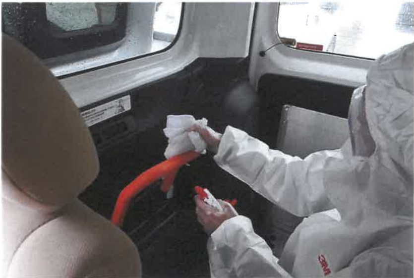
送迎車内アルコール拭き上げ②