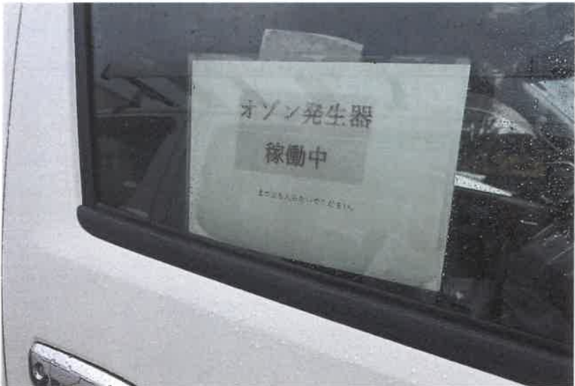
送迎車オゾン発生器稼働