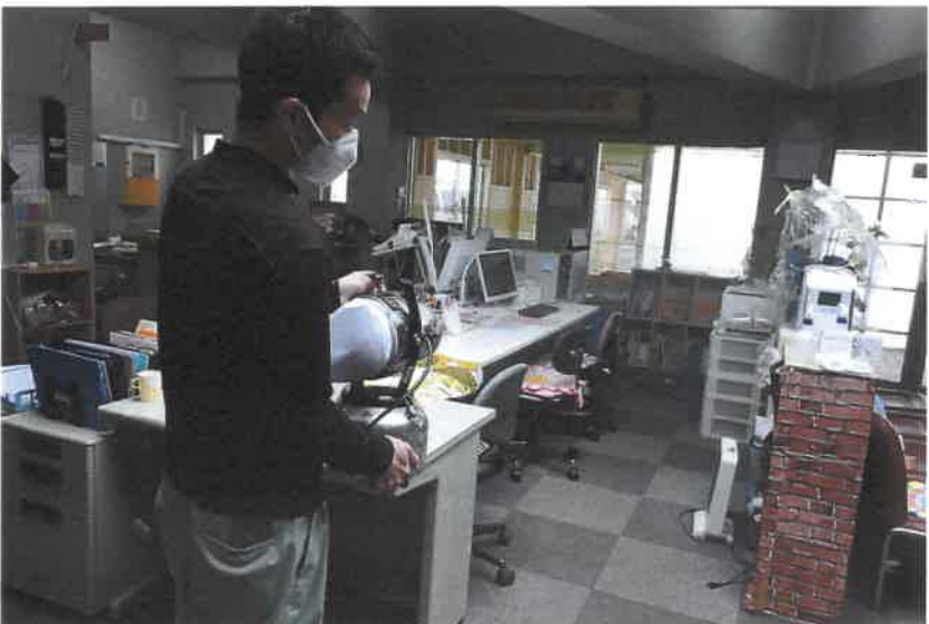
事務所内消毒薬噴霧