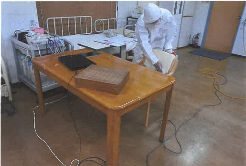
機能訓練室アルコール拭き上げ