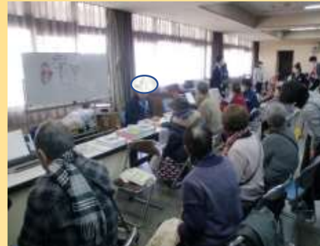
昨年のお役立ち展の様子