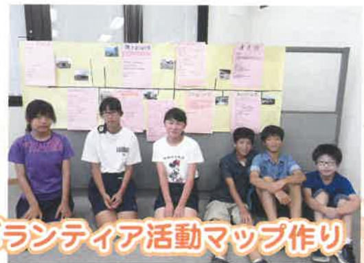
町内施設ボランティア活動マップ作り