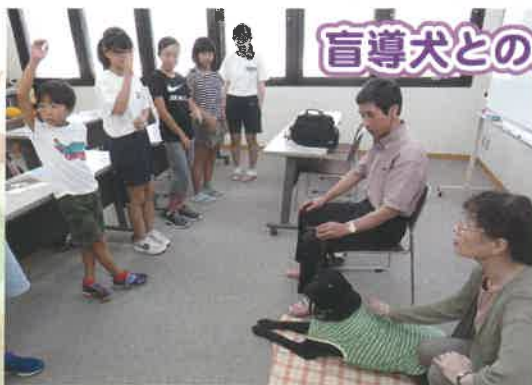
盲導犬とのふれあい