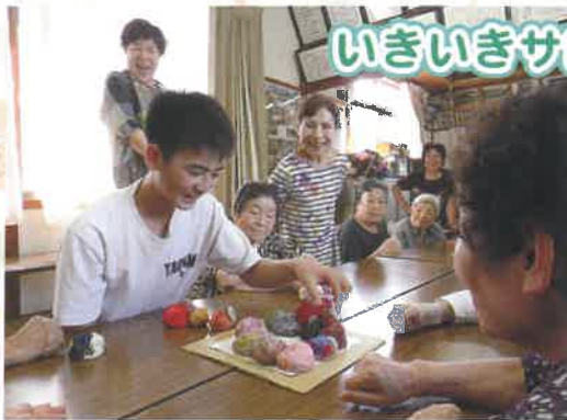
いきいきサロン交流