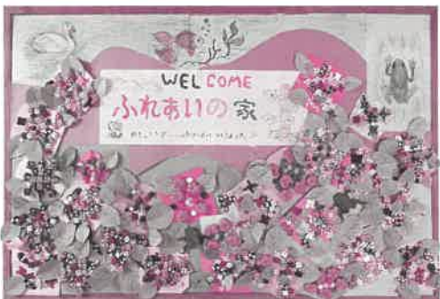
ふれあいの家 ギャラリー「田上のあじさい」