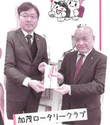
加茂ロータリークラブ

たくさん笑い、楽しい時間!! ふれあい集合昼食会 11月27日、65歳以上のひとり暮らしの方をご招待して開催しました。昼食会形式はコロナ禍で自粛していましたが4年ぶりに復活しました。 内容は、老人クラブ連合会の寸劇による活動紹介、デイサービスセンター康養園の介護員によるレクリエーションを行いました。椅子に座ったままでできる体操や各テーブル対抗でお手玉を使った棒倒しゲームを行い、皆さん他のテーブルに負けまいと白熱していました。 また、田上中学校の生徒たちとの交流では、手遊びやかるた取りを行い、笑い声が絶えませんでした。最後に生徒たちの演奏でみんな輪になって田上甚句を踊り、大変盛り上がりました。 なお、この事業は町民の皆様からいただいた 赤い羽根共同募金 が財源となっており、募金にご協力いただきました皆様、誠にありがとうございました。