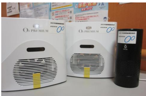
低濃度オゾン発生機