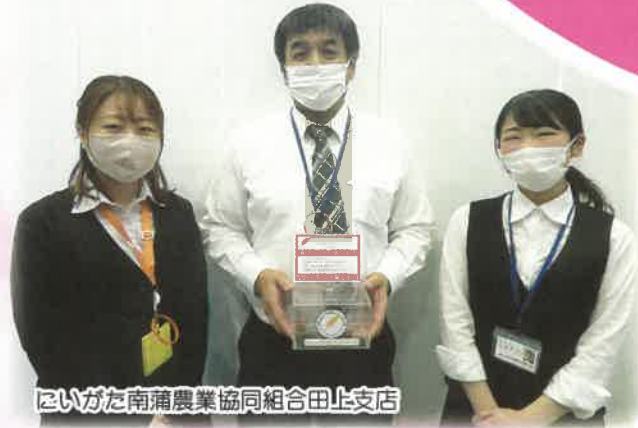
といがた南蒲農業協同組合田上支店