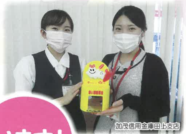
加茂信用金庫田上支店