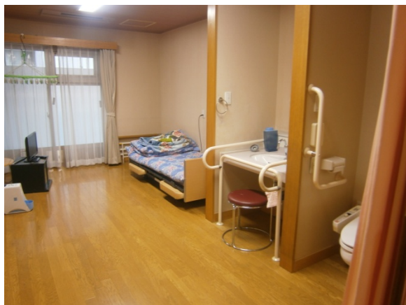
2床あります。毎日2人までご利用いただけます。