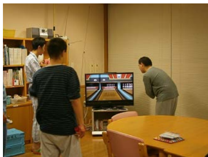
みんなでゲームをしています。