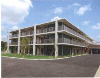
きらめきヴィレッジ

そこで、国・千葉県・市川市・鎌ヶ谷市・習志野市をはじめ、関係諸機関の深いご理解、ご支援により、いよいよこの理想の実現の運びとなり、社会福祉法人慶美会の各施設を建設いたしました。