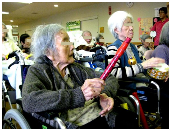
前でファシリテーターが誘導しています。合奏中は皆さんかなりの集中をされています。楽しみながらの全身運動です。

※ファシリテーター(進行役)は、前で大きなアクションで楽器を使います。また、「すごい」「かっこいい」「すてき」「さすが」など、間奏の間に必ず皆に声を掛けます。