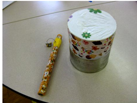
太鼓の胴は栄養科から譲ってもらったフルーツ缶、錫状の握りは新聞紙で製作。太鼓の腹や鈴等は100円ショップで購入。