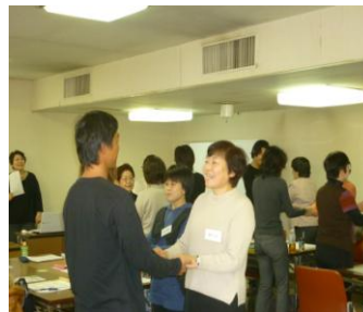
演習「自己紹介・相手を褒める」

・仲間内では自分の考えに頷いてくれ、同調してもらいたい こういふことがあると、「仕事が楽しい」「やりがいがある」