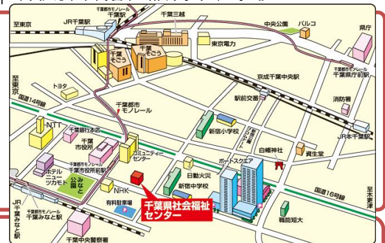
千葉都市モノレール「市役所前駅」から徒歩3分

日程・会場：7/23 (日) 千葉県社会福祉センター4階第1 8/5 (土) 千葉県社会福祉センター3階会議室 受講料：会員 6000円 非会員 10000円