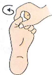
手で足の指をつまんで 1本ずつぐるぐる回す

足や足指は身体を支える大切な役割をはたしています。足指の体操はしっかりと身体を支える事に大変役立ちます。