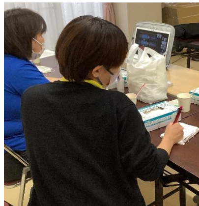
初級セミナー受講の様子(*^_^*)