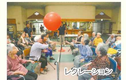
レクリエーション