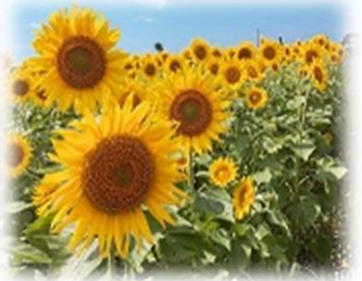
↑ ↑ お天気にも恵まれました♡ ↑ ↑