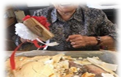
↑ えん樹での様子 鯛が顔を出した時の笑顔☆