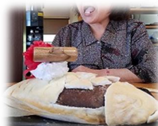
↑ そよ風での様子 割れてビックリされてました

もう一つのお祝いメニューといえば鯛の塩釜焼です!!卵白と塩を混ぜ合わせた生地で鯛を包み込み、オーブンで焼いていきます 焼き固まった塩釜を御利用者様に鏡開きのようには割って頂きました☆塩釜効果でふっくらに焼けた鯛が顔を出すと皆様笑顔に😊お味も塩加減が丁度よく御利用者様からも大好評のメニューでした♪♪