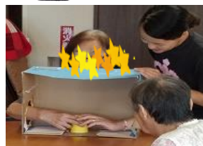
← そよ風での様子 箱の中身を当てるゲームに挑戦!最初は恐る恐る…徐々に触りながら、中身を当ててくださいました(^^)♪