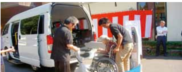
▲救護施設しみず園 リフト付車両整備事業

泉町区自治会（配分対象事業名：泉町公民館バリアフリー化事業） 配分額：110,000円