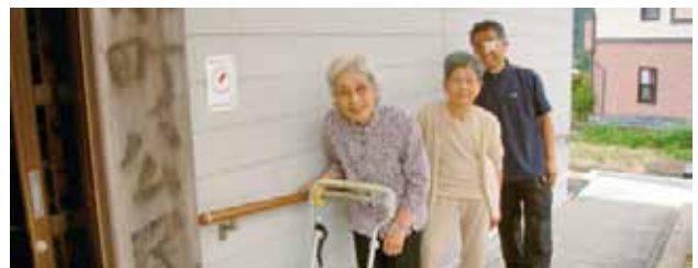
▲泉町区自治会 泉町公民館バリアフリー化事業