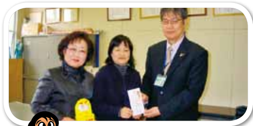
◀国際ソロプチミスト 佐賀中部様