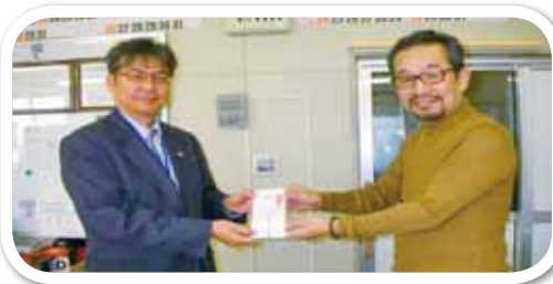
多久市ボーリング協会様▶