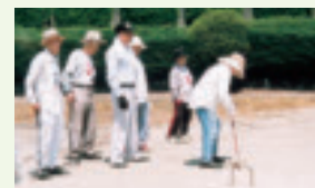
市老連 ゲートボール大会▶