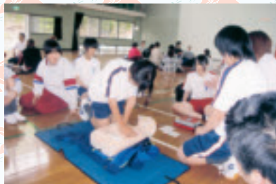
一生懸命学びました