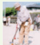
▲ 市老連 グランドゴルフ大会