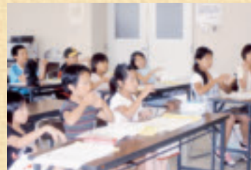
▲手話をおぼえよう