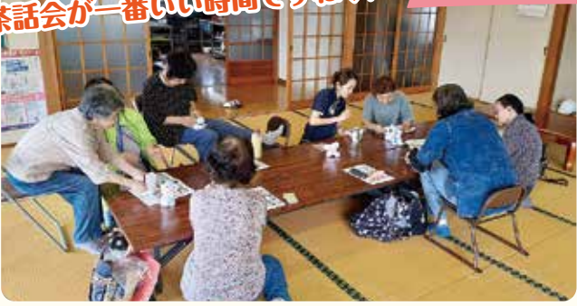
ひまわり会(石州分)