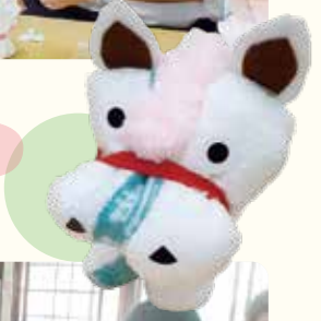
多久原おしゃべりサロン(多久原)