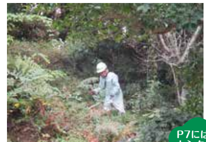
シルバー人材センター