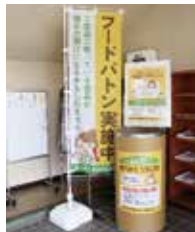
フードバトン事業 ありがとうBOX