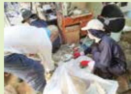
▲すっきりサポート