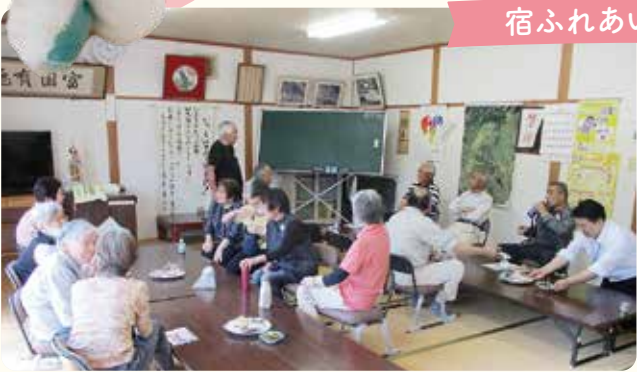
宿ふれあいサロン(宿)