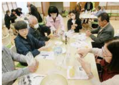
災害ボランティア研修