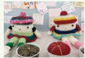
被災者の方と避難所で一緒に作成したディーワちゃん可愛いですね♪