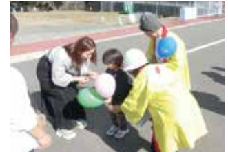
赤い羽根共同募金活動