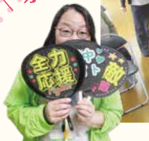
すこやかサロン(板屋)