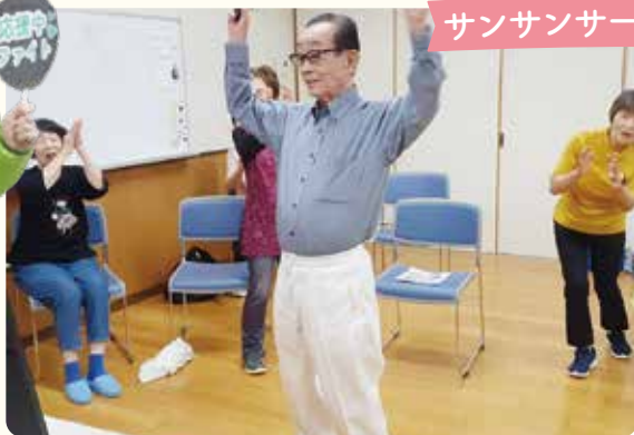
サンサンサークル(東多久合同)