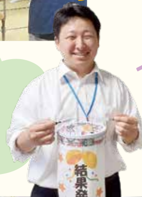
西の原ふれあいサロン(西の原)

男性の会員さんも ストライク!スペア!で万歳! サロンのみなさんで喜びを 分かち合いました(^^♪