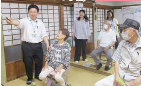
長尾みらいクラブ(長尾)