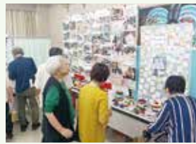
災害ボランティア活動の展示コーナー