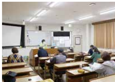
おでかけサポーター会議