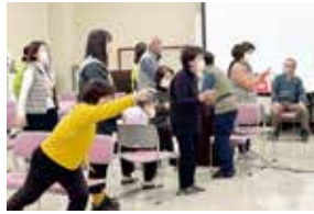
課題解決実践プロジェクト ゲームでボウリング