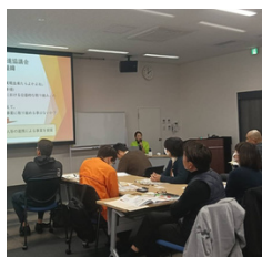
▲“地域貢献推進事業”について発表する職員

12月16日（火）市町社協実践発表会・12月17日（水）香川県・佐賀県内社協合同研修会において、多久市社協で取り組んでいる事業について担当職員が発表を行いました。