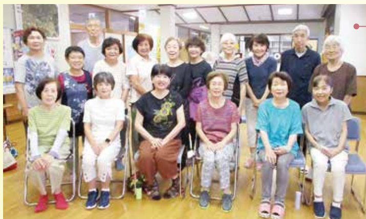
東多久合同サロン サンサンサークル

多久市では、現在 59 サロンさんが活動されています！認知症予防や茶話会などいろいろな取り組みを実施されています！