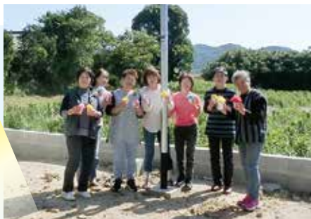
▲羽佐間区防犯灯設置(令和6年度実施)

公民館にスロープ、手すり設置、環境整備など、地域で暮らしやすい街づくりを支援いたします。