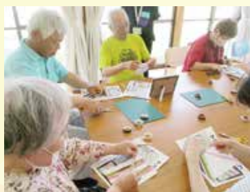
仁位所 サロン NITOCO