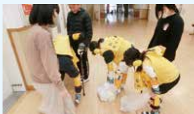
▲福祉教育体験講座(高齢者疑似体験)