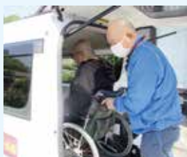
▲福祉有償運送事業