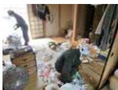
▲すっきりサポート