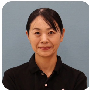
市丸紀香（いちまるのりか）