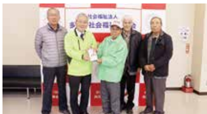
多久市グラウンドゴルフ協会様