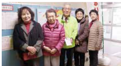
さわやかサークルひまわり会様