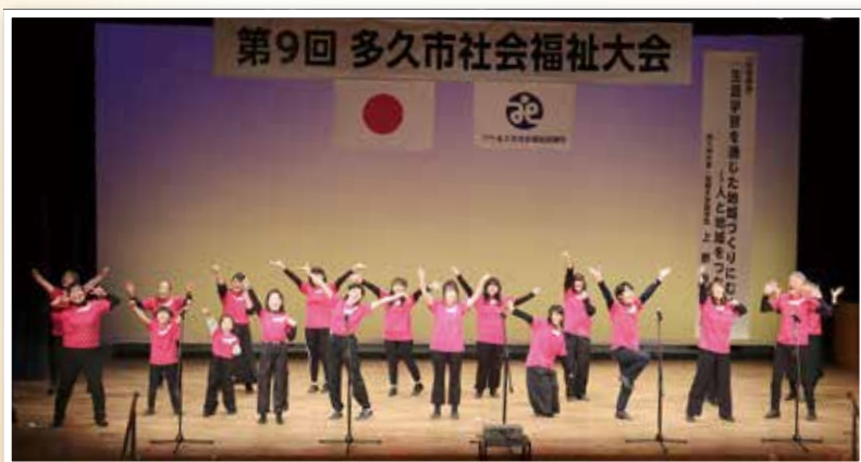
▲多久ミュージカルカンパニー