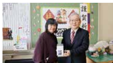
▲スマイル多久女の会