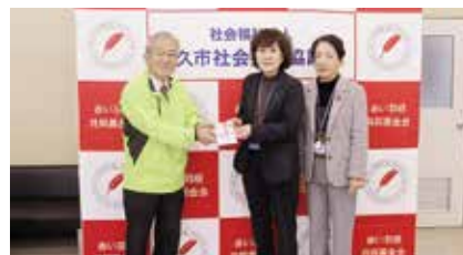
国際ソロプチミスト佐賀中部様