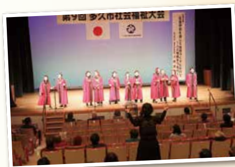
▲ Be Flying