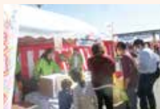
▲ふれあい広場（多久まつり）