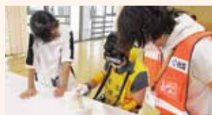
▲福祉教育体験講座

公民館にスロープ・手すり設置・環境整備など、地域で暮らしやすい街づくりを支援いたします。