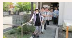
▲両子区 公民館スロープ設置（令和4年度実施）