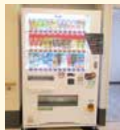
▲ケアハイツやすらぎ