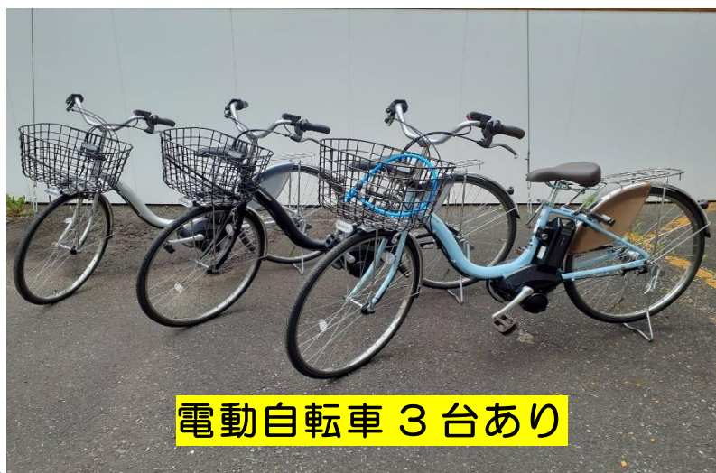
電動自転車 3台あり