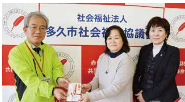
国際ソロプチミスト佐賀中部 様

GG 大会で「ホールインワン」達成の方や、会員の皆さまより 寄付を募り、1年間集めていただいたものです。