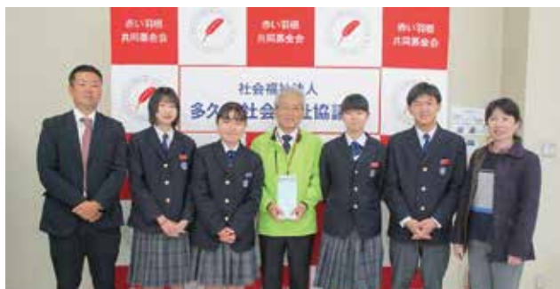
東原庫舎西溪校 様

誰もが安心して年末の時期を過ごすことができるようお願い、毎 年寄付をいただいております。