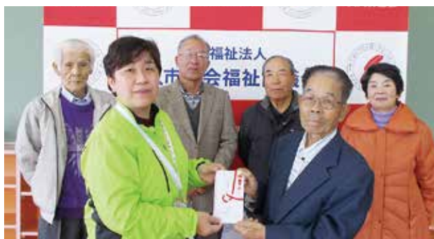
多久市グラウンドゴルフ協会 様

GG 大会で「ホールインワン」達成の方や、会員の皆さまより 寄付を募り、1年間集めていただいたものです。