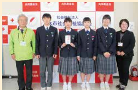
東原庫舎西溪校 様