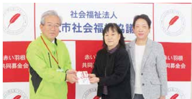
国際ソロプチミスト佐賀中部 様

GG 大会で「ホールインワン」達成の方や、会員の皆さまより寄付を募り、1年間集めていただいたものです。