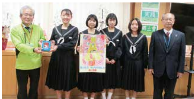
東原庫舎東部校 様

誰もが安心して年末の時期を過ごすことができるようお願い、毎年寄付をいただいております。