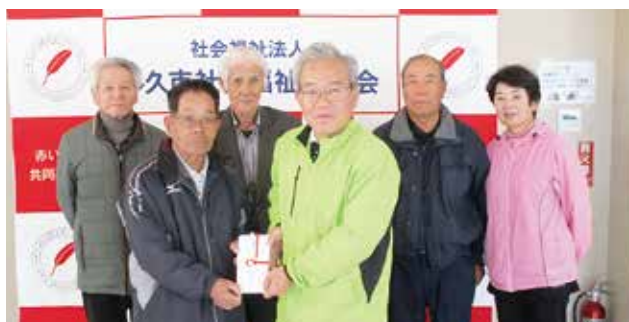
多久市グラウンドゴルフ協会 様

GG 大会で「ホールインワン」達成の方や、会員の皆さまより寄付を募り、1年間集めていただいたものです。