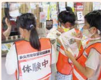
ボランティアスクール体験中！

地域福祉活動・ボランティア活動育成・ 福祉教育体験学習のために 1,122,246円