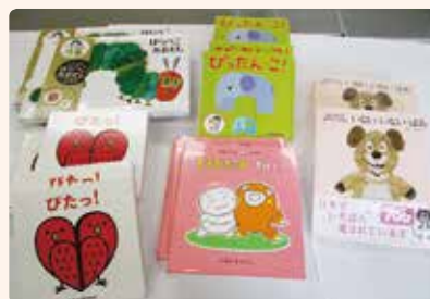
・身障相談事業・新生児に絵本の贈呈 ・学校ボランティア協力校への助成