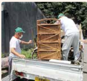
「わかちあいの和」活動風景