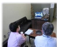
【オンラインで参加する 行政・社協職員】

災害時における被災者支援を円滑に実施できるよう、平時より連携体制の構築・強化に取り組めるよう県社協主催で研修会が行われました。多久市では、令和元年8月豪雨災害が発生し、災害ボランティアセンターの支援体制の必要性を改めて感じました。研修に参加し、今後の運営に生かせる良い研修となりました。