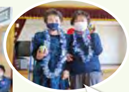
ターゲットゲーム 優勝したよ(^^♪