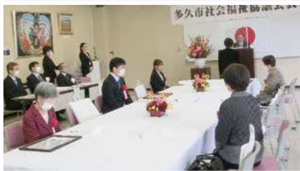
被表彰者代表の謝辞