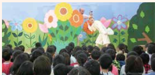
・新生児に絵本の贈呈 ・子ども観劇会