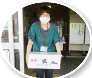
▲ 社協まで緊急食料品の受取りが難しい方は、社協職員がご自宅まで配達しました。