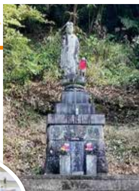
鬼子母神石碑 (筋原区)