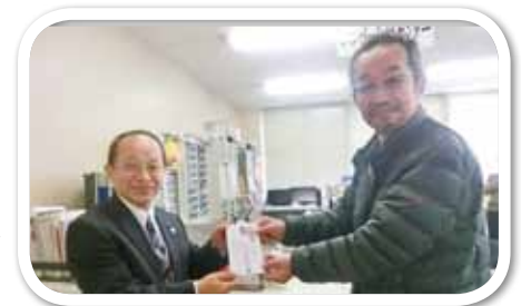
多久市ボウリング協会様▶