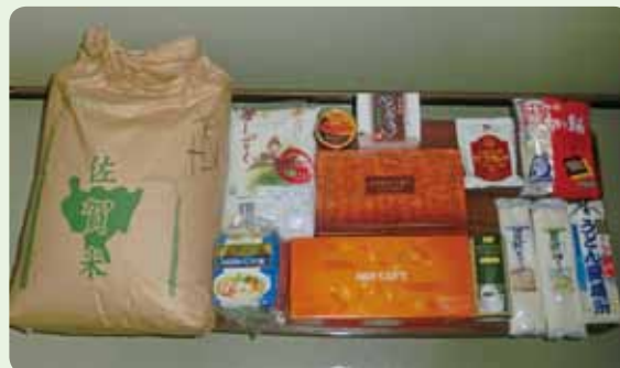
▲市民の皆様から寄付頂いた食品

多久市社会福祉協議会の窓口までお持ちいただくか、電話にてお問い合わせください。もしくは、社協職員が自宅まで直接お伺いいたします。