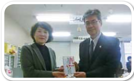
◀国際ソロプチミスト 佐賀中部様