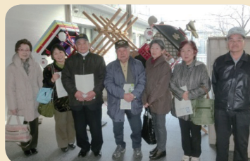
◀ 多久市ボランティア連絡協議会のボランティア会員のみなさん