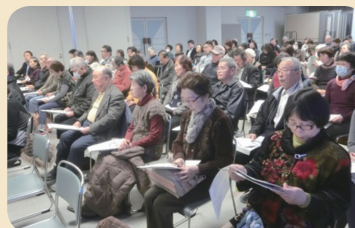
◀ たくさんの方が研修に参加されました

また、研修へ県内から多くのボランティアの方々が参加され、ボランティア活動への関心の強さと、熱意を感じることができました。