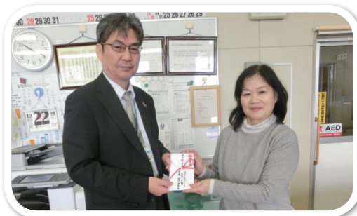
◀国際ソロプチミスト 佐賀中部様