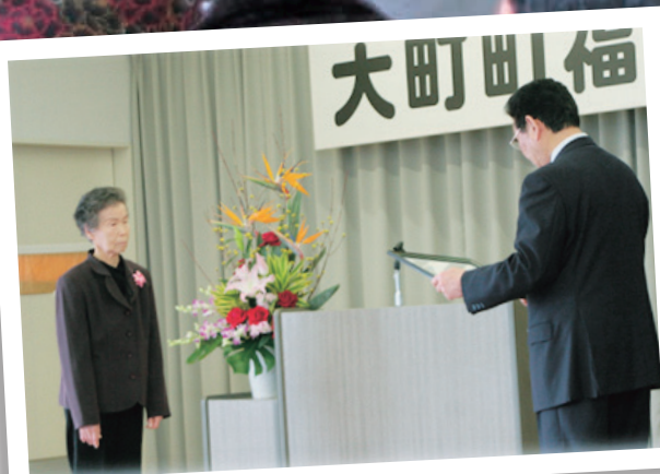
「第7回おおまち福祉のつどい」へ たくさんの御来場ありがとうございました。