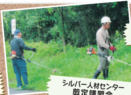
シルバー人材センター 除草ボランティア