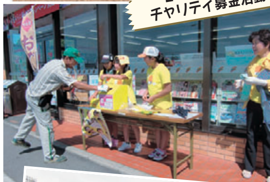
24時間テレビ チャリティ募金活動