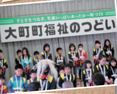
第5回福祉のつどい