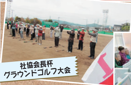
社協会長杯 グラウンドゴルフ大会