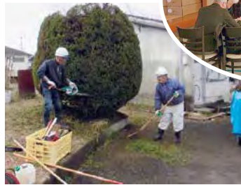
▲入会相談会の様子

問合せ先 社会福祉法人大町町社会福祉協議会内 大町町シルバー人材センター ☎0952-71-3001