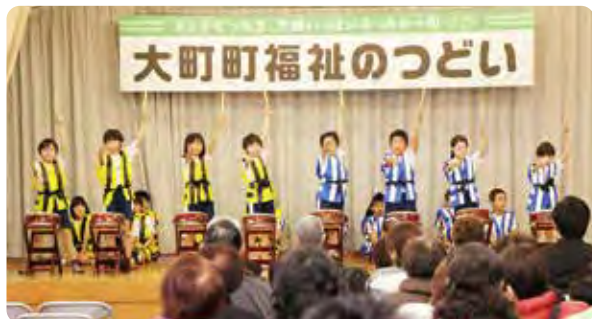
大町ひじり学園小学部 3 年生による 子ども太鼓の演奏