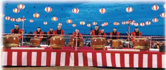
大町ひじり太鼓の皆さんによる演奏