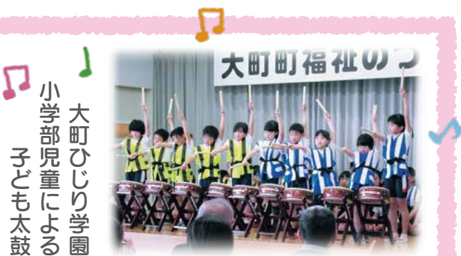
大町ひじり学園 小学部児童による 子ども太鼓