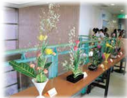
● 大町保育園 ● こども生け花教室