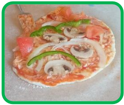
学生さんと作成した ピザ