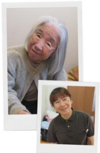
さわやか憩いの家 大野城中央 西島 英誉

一緒に喜ぶたかったです。Aさんからいつどうなるか分からない命の儚さ大切さを教えていただきました。一日の積み重ねが人生となるこの言葉を大切に、あの経験を胸にお一人おひとりの一日を大切に少しでも笑顔で過ごしていただけるよう務めています。