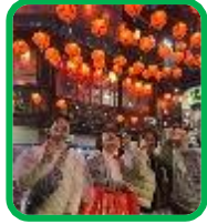
左は九份 下は国立大学