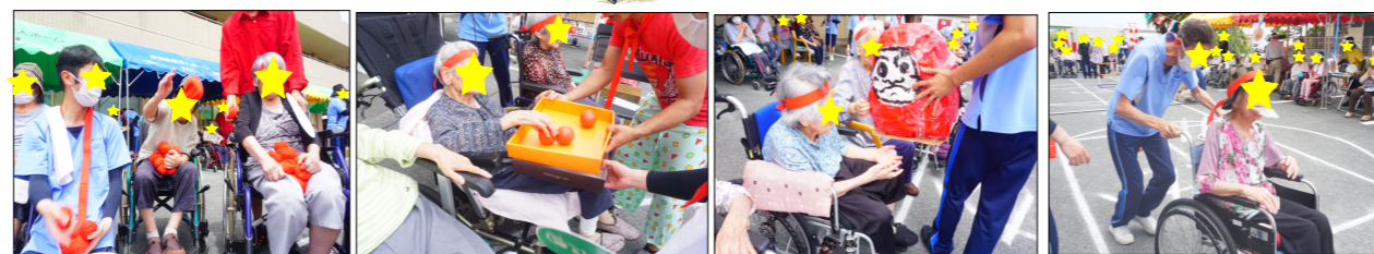
たくさん入れるぞー！