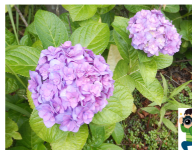
紫陽花が綺麗な季節です