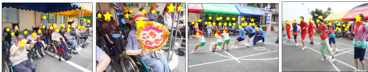
頑張れー頑張れー！！