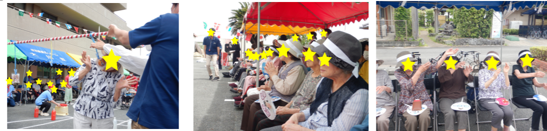
「パン食い競争です」