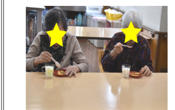
「美味しかったです」

料理教室を行いました。今月は「フレンチトースト」を作りました。ご利用者様には材料を混ぜるなどして頂きホットプレートで焼き上げるとこんがり美味しく焼きました。おやつ時間に召し上がり、美味しいと言っていました。