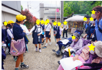
たくさん見学してきました

藩境まつりに行ってきました。会場では昔ながらの街並みを散策され、建具屋や生地屋等を見学されました。また、小学生の研究発表を聞かれました。楽しそうな様子を見せられていました。