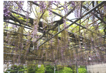
藤の花が綺麗でしたね！

中山の大藤まつりに行ってきました。まつりの最終日でしたが天候にも恵まれ、ゆっくりと藤の花を鑑賞されました。「きれいかね。見れてよかったですよ。」と言われていました。