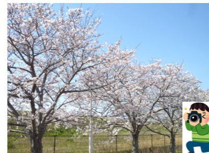
大川荘の桜が満開