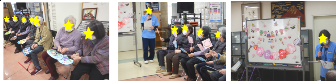
ゲームで楽しめました！