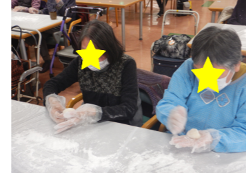
「小餅を丸めてもらいました」