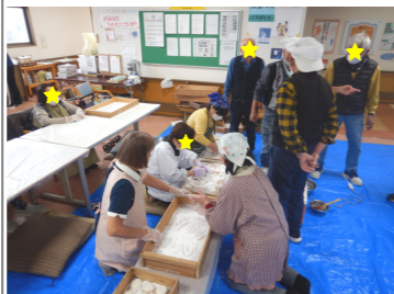
「ボランティアの方、いつもありがとうございます。」