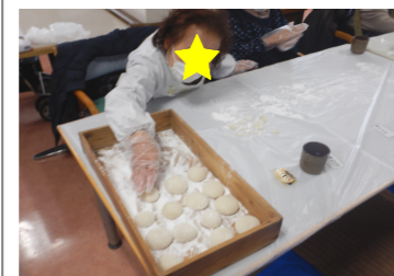
「せり箱へ並べます」