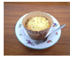
さつまいもマフィン