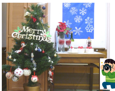
メリークリスマス