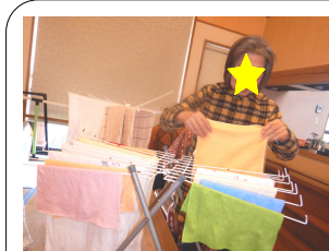
「ありがとうございます」