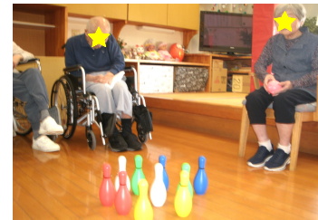
ボウリングをしました！