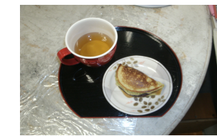
綺麗に出来ました！