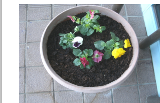
大切に育てますね！

ご利用者の皆様で、「園芸」を行いました。パンジー等の苗をプランターに植えて頂き、「綺麗ですね」と言われていました。入り口に飾っておりますので、ぜひご覧ください。