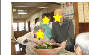
慎重に植えています！