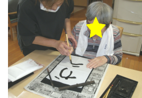
丁寧に書かれています。