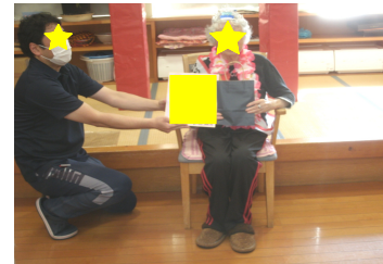
綺麗な色紙を頂きました！