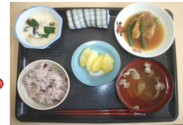
昼食は好物を用意しました！