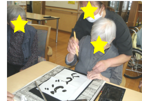
バランスはどうですか？

書道を行いました。ご利用者の皆様に「秋にちなんだ言葉」の課題を出し、書いて頂きました。皆様思い思いの秋を文字にされていました。