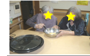
皆様交代で混ぜます！