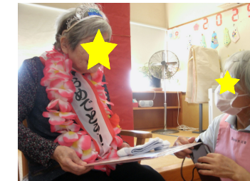
職員からのプレゼント！

10月10日と10月14日に誕生会を行いました。ご利用者様は職員のプレゼントに「うれしかー！」「私のためにありがとうございます」と言われていました。