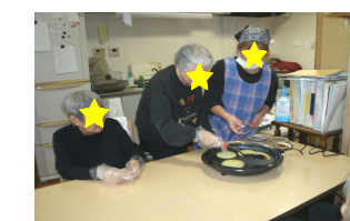
熱いので気を付けて！