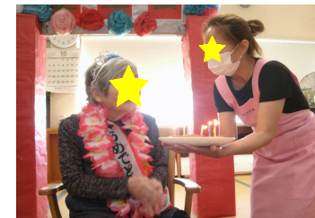
お祝いのケーキです！