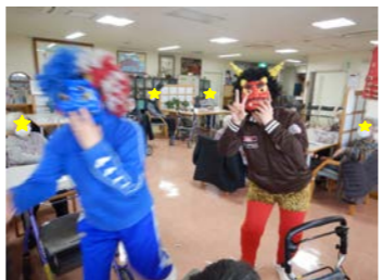
赤鬼と青鬼がやってきました!