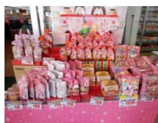
お雛様行事のお菓子