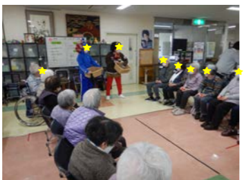
ゲームで楽しみました。