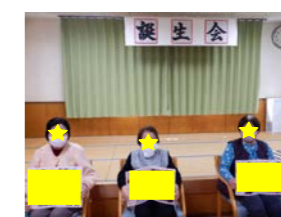
おめでとうございます!