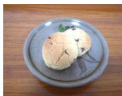
チョコチップクッキー