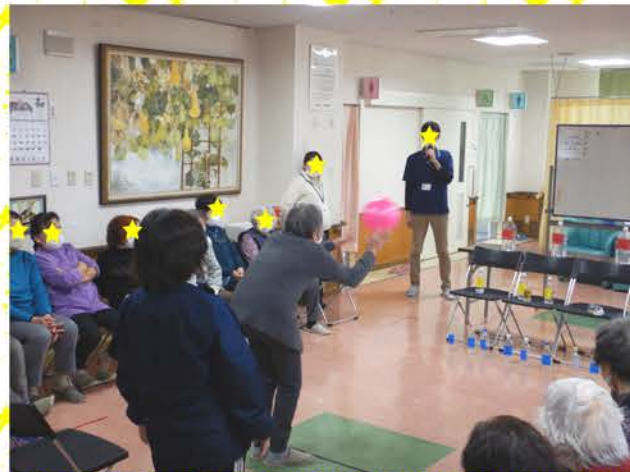
(バウンドボウリング)