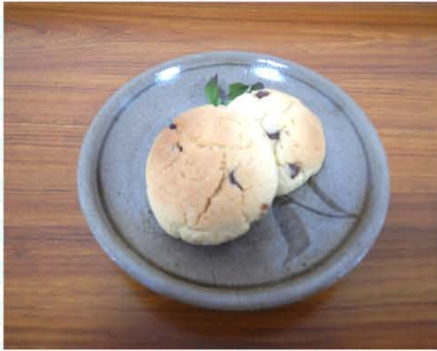
(チョコチップクッキー)